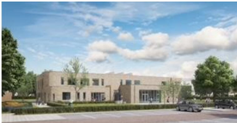
Ons nieuwe gebouw wordt dit schooljaar gebouwd!!!

Ons oude gebouw is afgebroken om plaats te maken voor een prachtig nieuw gebouw. Wij zullen dit nieuwe gebouw in dit schooljaar, '22-'23, te betrekken, en overbruggen daarom momenteel nog op twee locaties. Onze groepen 1 t/m 4 wonen tijdelijk in bij de onderbouw van de burenschool het Kompas. Deze locatie noemen we : locatie Groenhouten. De Hobbit maakt er gebruik van vier lokalen en een groot deel van de hal t.b.v. spelen en werken voor de groepen 1/2/3. Samen delen we het speellokaal, de bibliotheek en de centrale hal. Eén lokaal wordt gehuurd door Kinderopvang Humankind als BSO ruimte. De groepen 5 t/m 8 ontvangen hun onderwijs de eerste schoolmaanden nog in het voormalige gebouw van de Holm, aan de Lingewijk 13. Ook dit gebouw -dat we locatie Lingewijk noemen- gebruiken wij samen met het Kompas; wij hebben er vijf lokalen tot onze beschikking en het Kompas drie. Ook daar is een grote hal voor midden- en bovenbouw, waar elke dag verschillende activiteiten plaatsvinden. In deze hal zijn ook tal van materialen terug te vinden die betrekking hebben op techniek, handvaardigheid, verdieping en verrijking en een uitgebreide bibliotheek. In september zijn er rond de 185 leerlingen op de Hobbit, gedurende het schooljaar neemt dit aantal behoorlijk toe door nieuwe aanmeldingen. Zij zijn verdeeld over in eerste instantie 7 en vanaf november 8 groepen. Voor de gymnastieklessen van groep 3 t/m 8 maken wij dit schooljaar gebruik van sporthal De Korf.