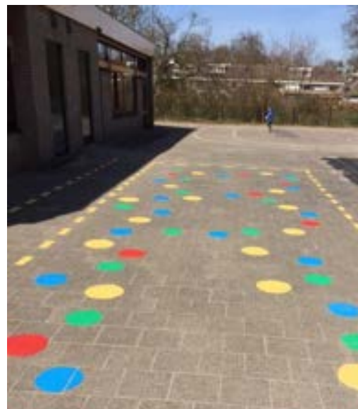
Schoolplein bij de "oude" Hobbit!