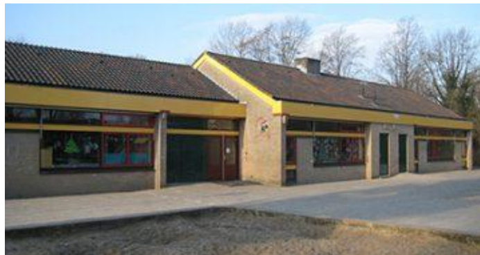
Nostalgie: de oude Hobbit!

In de maand oktober van ieder schooljaar verschijnt van de hand van de penningmeester een financieel jaarverslag over het achter ons liggende schooljaar. Daaraan voorafgaand heeft de Kascontrolecommissie de OR- boekhouding gecontroleerd. Alle ouders worden m.b.t. de verschijningsdatum van het jaarverslag geïnformeerd en hebben inzicht in de cijfers.